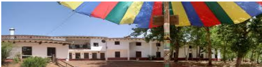
Centro de Naturaleza "El Remolino"